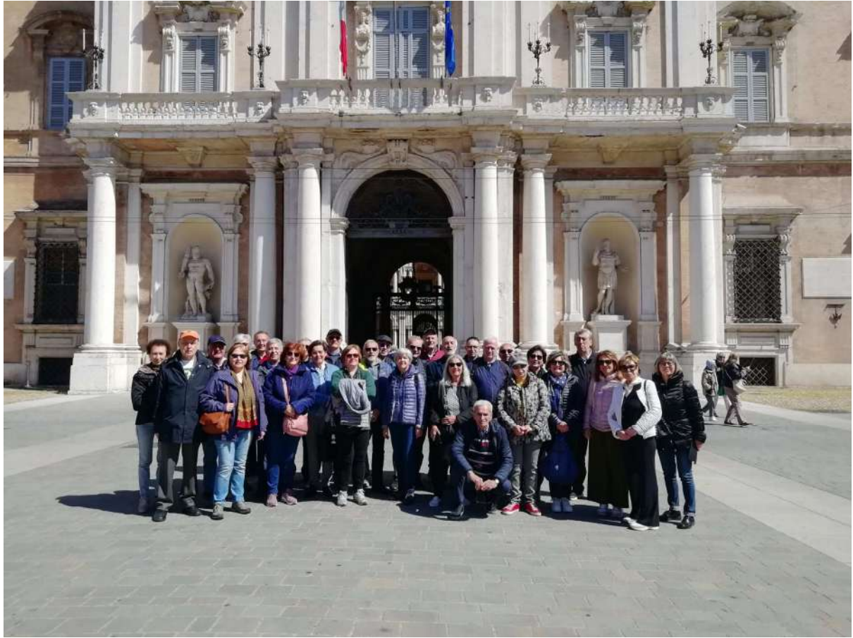
Foto Iniziative DTB Culturale e Hobby Visita di Modena